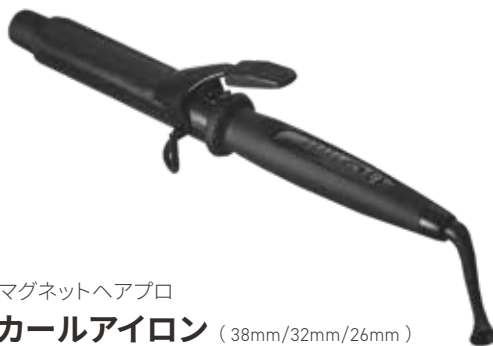
マグネットヘアプロ カールアイロン (38mm/32mm/26mm) ¥15,840

ミネラルを含んだ数種類の天然鉱石をマイクロパウダー化して独自配合し、アイロンのプレートとパイプ部に加工。髪にツヤと潤いを与え、弾力のある艶カールを長時間キープします。髪本来の素材を内側から根本的にケアする「ホリスティックビューティ」発想のカールアイロンです。電源ONからわずか45秒で使用ができる超高速温度上昇を実現。忙しい朝でも時短スタイリングを可能にします。