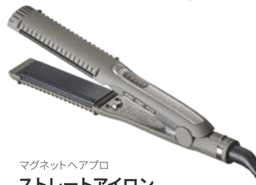
マグネットヘアプロ ストレートアイロン ¥12,870

潤滑性が高く、キューティクルを傷めずにスタイリングが可能。また、特殊加工されたアイロンプレートから発せられる「テラヘルツ波(育成光線)」による皮膜形成効果で、キューティクルを引き締め、ツヤのある美しい髪へと導きます。フッ素加工された特殊ラバーが搭載されたプレートが髪をしっかりホールド。適度なテンションをかけながら強いクセも素早く伸ばします。毛先の外ハネや根元の立ち上がりなどしっかりカールをつけたいスタイリングにもおすすめです。