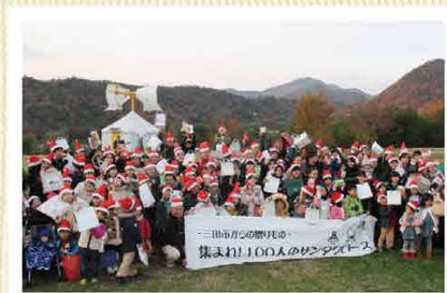
※写真は昨年の様子です